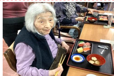
ちよだ寿司にてテイクアウトし、お寿司を召し上がりました。「おいしい」と喜んでくださいました。